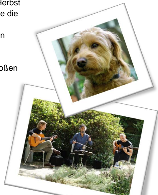
Oben: Therapiehündin Gerti. Unten: Das Sommerkonzert mit dem Trio Ziriyab

Und erneut fanden regelmäßig Gartenkonzerte statt, ein besonderes Erlebnis für die Betroffenen, aber auch für viele Mitarbeitende. Zahlreiche Kölner Musikerinnen und Musiker haben sich hierfür spontan bereit gefunden. Ihnen allen gilt unser besonderer Dank, u.a. auch der Kölner Hochschule für Musik und Tanz und vielen ihrer Studierenden sowie dem Collegium musicum der Universität zu Köln.